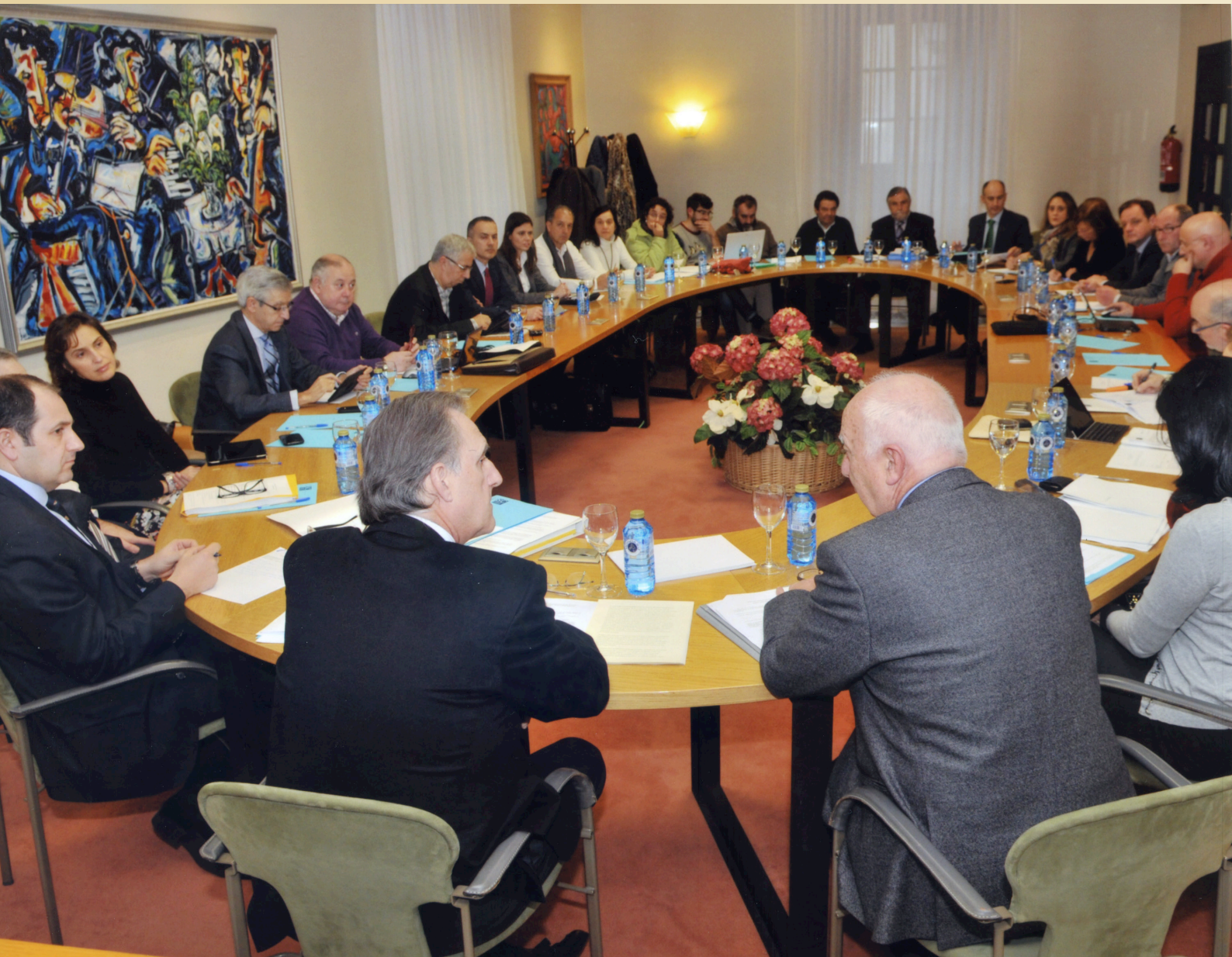
Celebración dun pleno no Consello Social