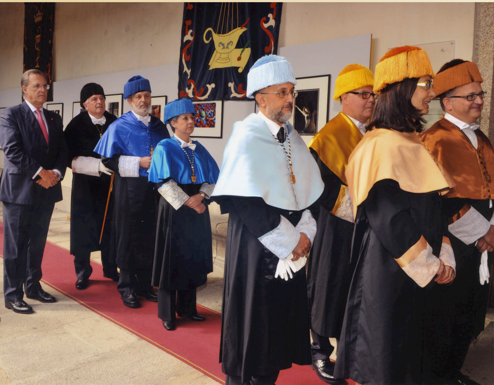
Apertura do curso académico