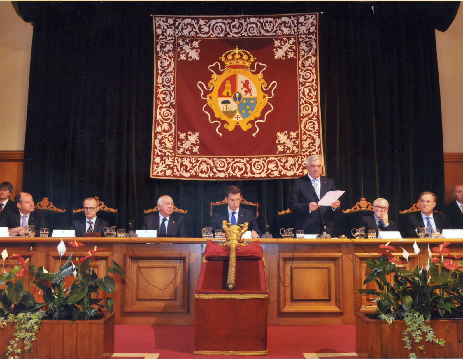
Toma de posesión do Reitor