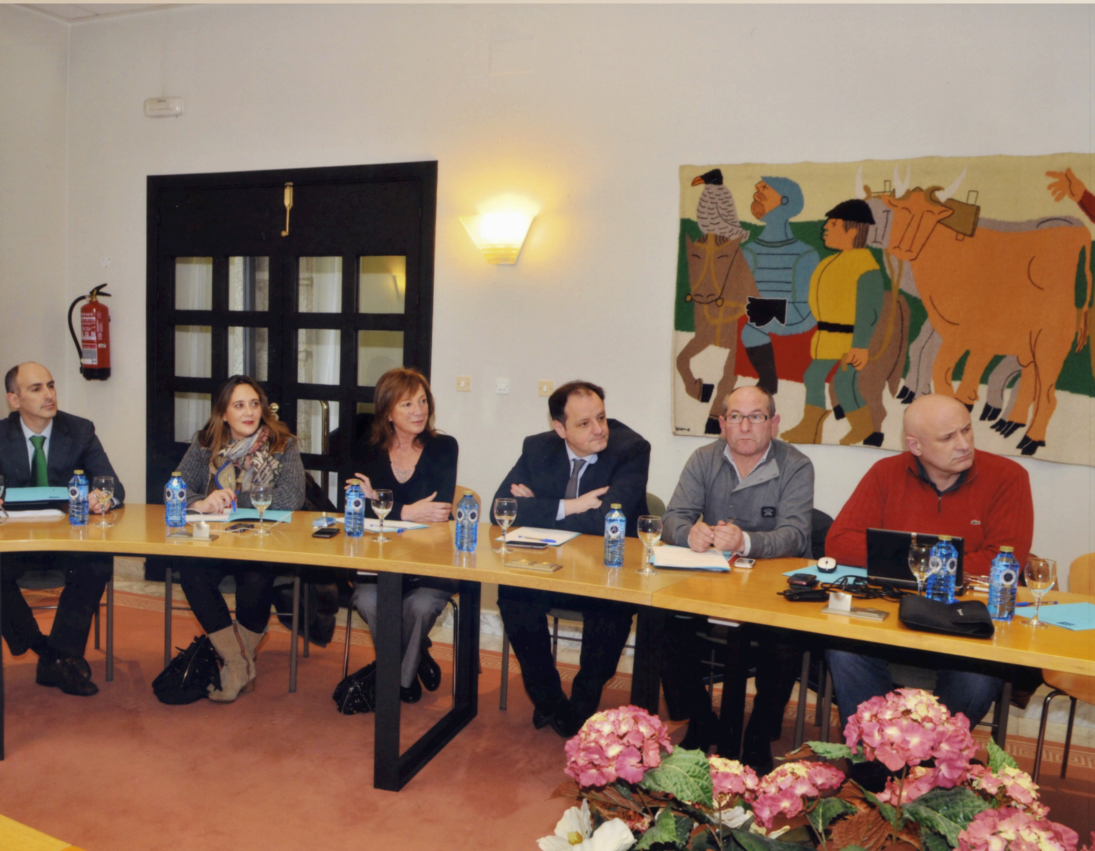
Celebración dun pleno