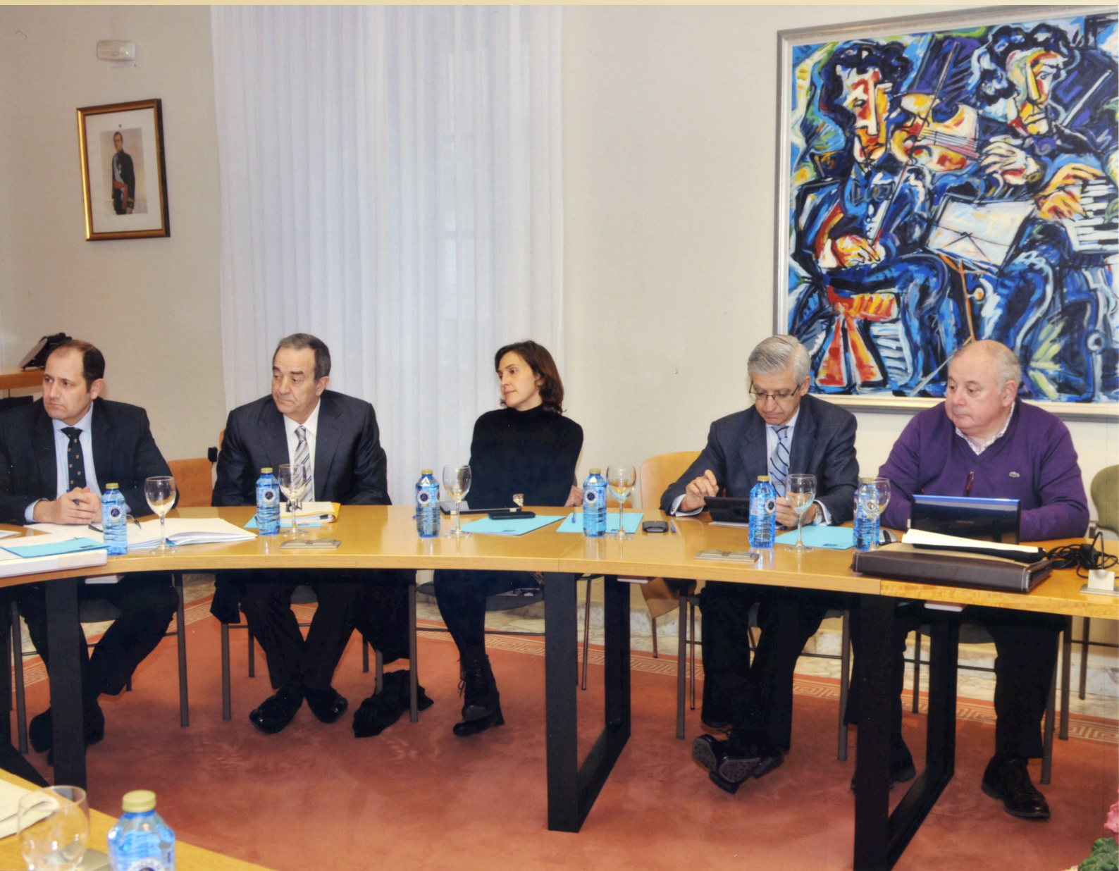
Celebración dunha sesión do Consello Social