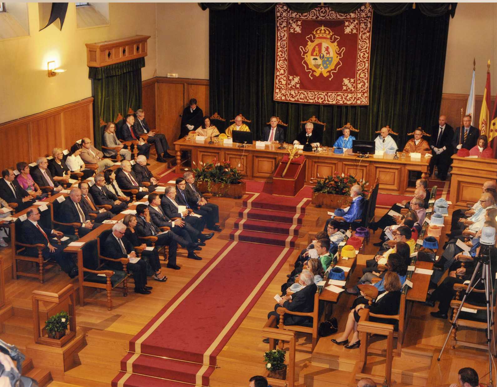
Apertura do curso académico