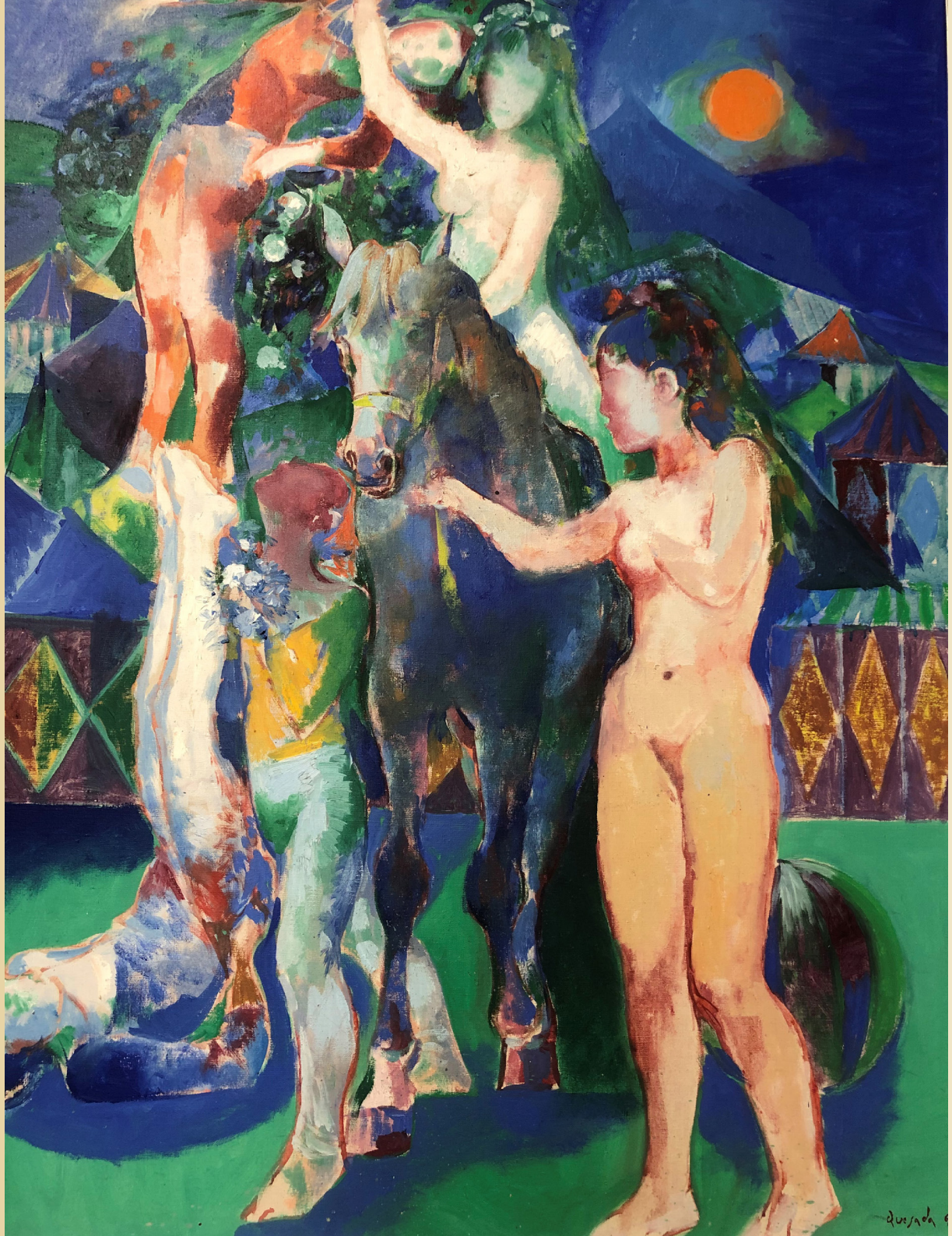
Circo. X. Quesada