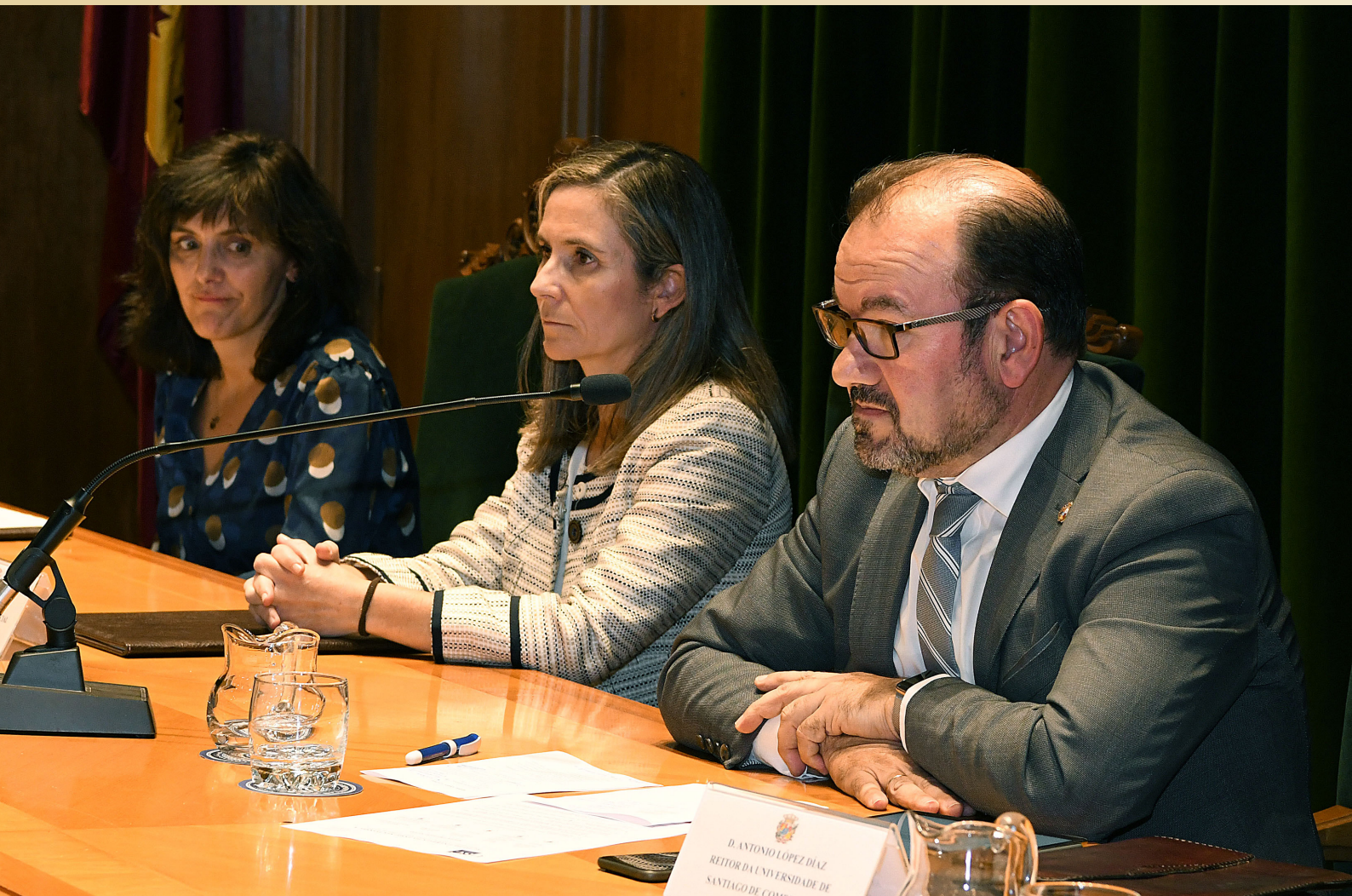
Acto de inicio do curso