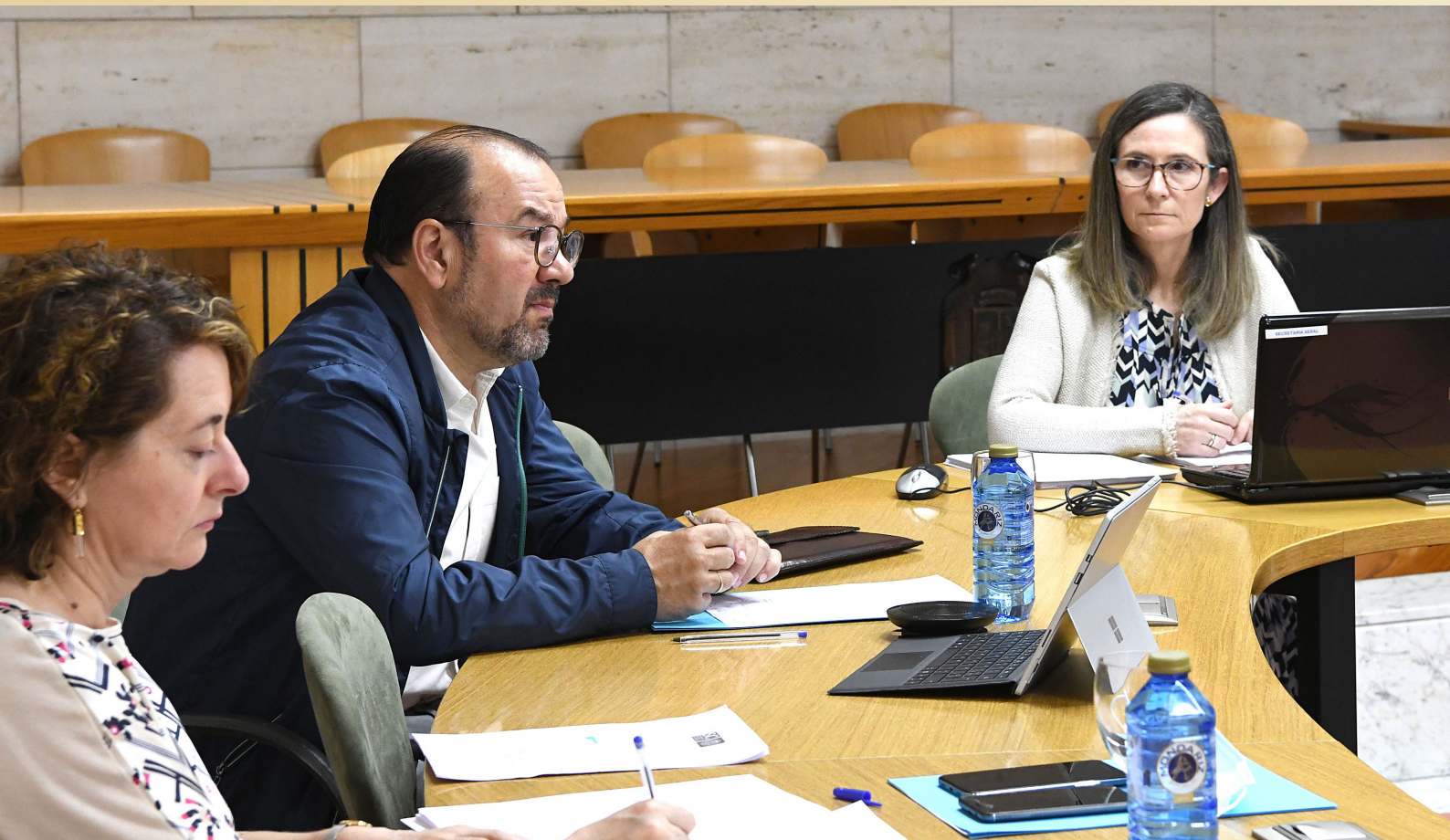
Reunión Consello Social