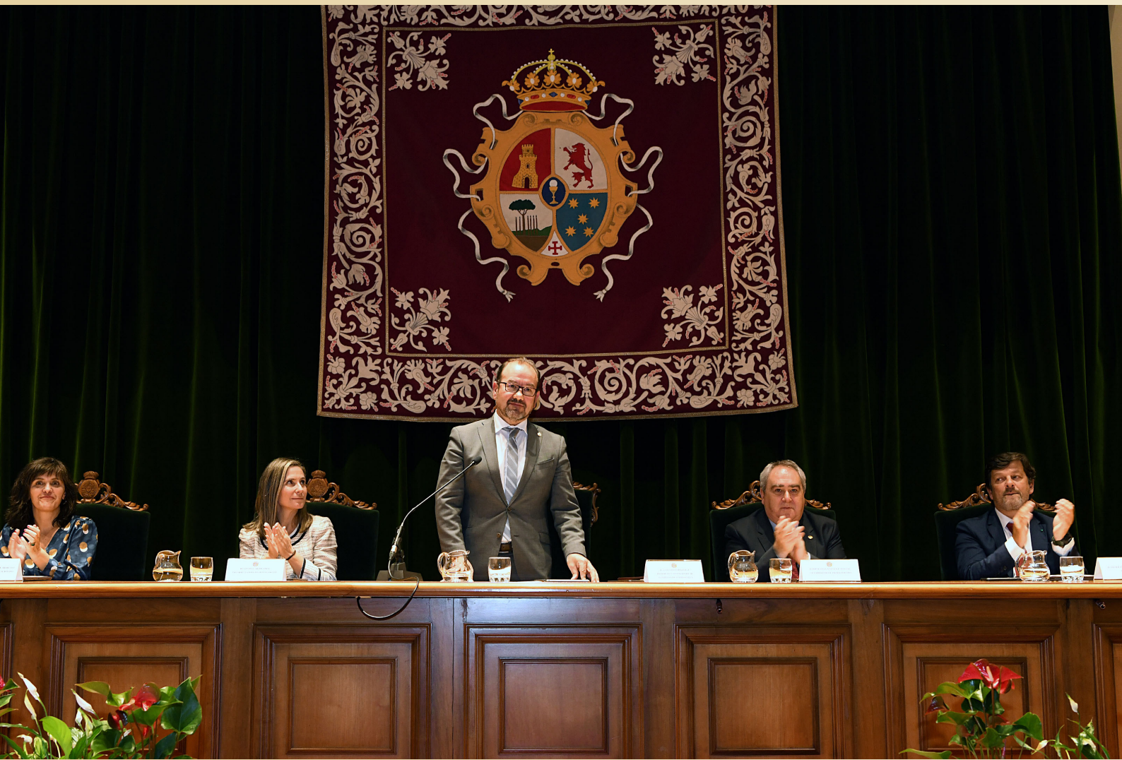
Acto de inicio do curso