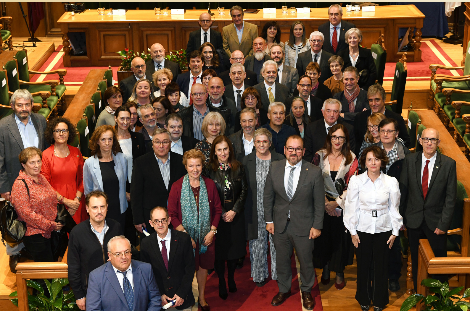
Acto de inicio do curso