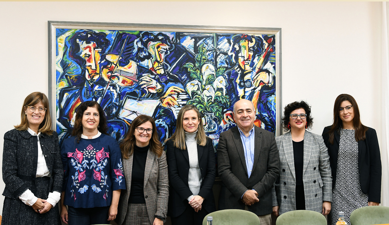
Programa Desafios Empresariais con Perspectiva de Xénero